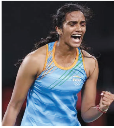
19-21 से हार का सामना करना पड़ा।